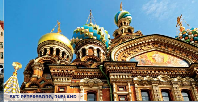
SKT. PETERSBURG, RUSLAND